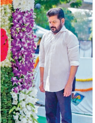
53.90 లక్షల కుటుంబాలకు 200 యూనిట్ల వరకు ఉచిత విద్యుత్ ఇస్తున్నామని గుర్తుచేశారు. హనుమంట్ లో అమరవీరుల స్మృతిని రెవెన్యూశాఖ మంత్రి పొంగులేటి శ్రీనివాస రెడ్డి వద్ద సీఎం రేవంత్ అర్పించారు.

ప్రభాతవార్త ప్రధాన ప్రతినిధి హైదరాబాద్, జూన్ 2: తెలంగాణ అవతరణ దినోత్సవ వేడుకలు రాష్ట్రవ్యాప్తంగా ఘనంగా జరిగాయి. సికింద్రాబాద్ పరేడ్ గ్రౌండ్స్ లో రాష్ట్ర అవతరణ దినోత్సవ వేడుకలలో సీఎం రేవంత్ రెడ్డి మంత్రి పాల్గొన్నారు. సీఎం రేవంత్ రెడ్డి తెలంగాణ ఆసెంబ్లీ సమీపంలోని గనపాల్కొ వద్ద అమరవీరుల స్మృతిని నివాళులు అర్పించారు. అనంతరం సికింద్రాబాద్ పరేడ్ గ్రౌండ్స్ లో జాతీయ పతాకాన్ని ఆవిష్కరించి తెలంగాణ ప్రజలకు శుభాకాంక్షలు తెలిపారు. జిల్లాల్లో సంబంధిత మంత్రులు జాతీయ జెండా ఆవిష్కరించారు. రాష్ట్ర అవతరణ దినోత్సవం సందర్భంగా రాష్ట్ర వేళ్లలో హైదరాబాద్ లోని సచివాలయం, ఆసెంబ్లీ భవనాలను విద్యుత్ దీపాలతో సుందరంగా ఆలంకరించారు. రాష్ట్ర అవతరణ వేడుకల్లో భాగంగా డిప్యూటీ సీఎం భట్టి విక్రమ్మార్జున్ ఖమ్మంలో జాతీయ జెండాను ఆవిష్కరించారు. ఆయన మాట్లాడుతూ తొలి విడతలో 4.50 లక్షల మందికి ఇందిరమ్మ ఇళ్లు మంజూరు చేసి, రూ.22 వేల కోట్లు ఖర్చు చేస్తున్నట్లు తెలిపారు.